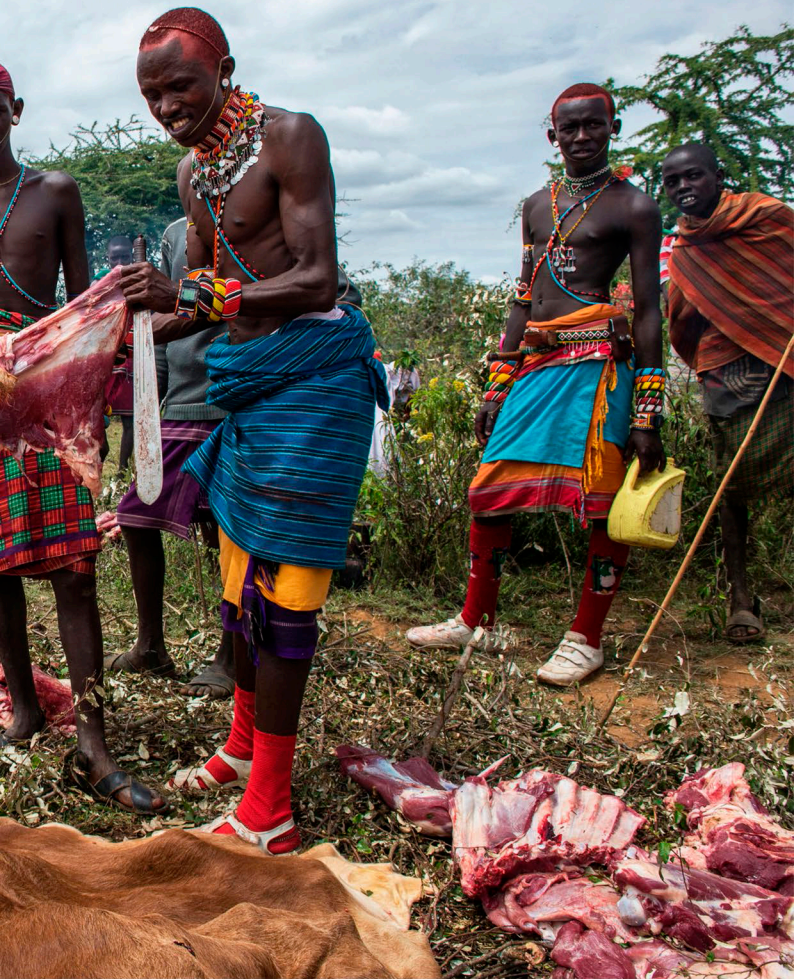
In de ochtend starten de krijgers met het slachten van vee en het verzamelen en opdrinken van het bloed.